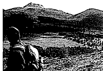
■ Puy de Dôme p.10