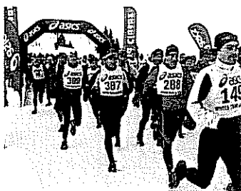
■ Trails Blancs p.6 et 7

preuve de pragmatisme. C'est ainsi que le CAF du Léman a organisé l'hiver dernier les championnats d'Europe à Morzine pour la FFME. Preuve que les mentalités évoluent, mais plus lentement que les pratiques. Ainsi, le ski de rando n'échappe pas à la «sportivisation» de l'outdoor. Le succès des montées sur pistes de ski damées, comme le Mountain Ski Tour Somfy ou le développement d'une pratique de mise ne forme, type rando-jogging, le démontrent. Autre tendance, la rando-freeride, pour les skieurs en quête de pentes vierges. Autant de courants susceptibles d'amener de nouveaux pratiquants. Aux fédérations de savoir s'adapter. suite p.8