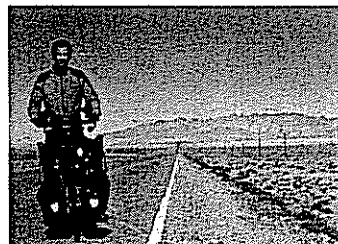
■ Cyclotourisme p.12