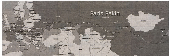
Le tracé du parcours

digéré en 13 jours avec la traversée de Volgograd (ex Stalingrad) et la descente le long de la Volga, le plus long fleuve d'Europe qui a inspiré écrivains et artistes. Ensuite, ce seront les grandes steppes du Kazakhstan et leurs bivouacs aux décors grandioses. Une halte au centre d'essais spatial soviétique de Baïkonour, et direction le Kirghizistan, pays des youttes et des chevaux. Là encore, les échanges avec les habitants resteront dans les mémoires. Le compteur affichera alors quelque 8 000 kilomètres mais l'aventure n'en sera pas terminée pour autant. Des cols à 3 000 mètres d'altitude les attendent, ils devront contourner le lac Isik-Köl, deuxième plus grand lac naturel au monde avant d'attaquer le morceau de bravoure du raid, le parcours chinois et ses 3 887 kilomètres.